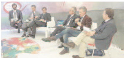
Milano La tavola rotonda sul progetto Payroll Giving.