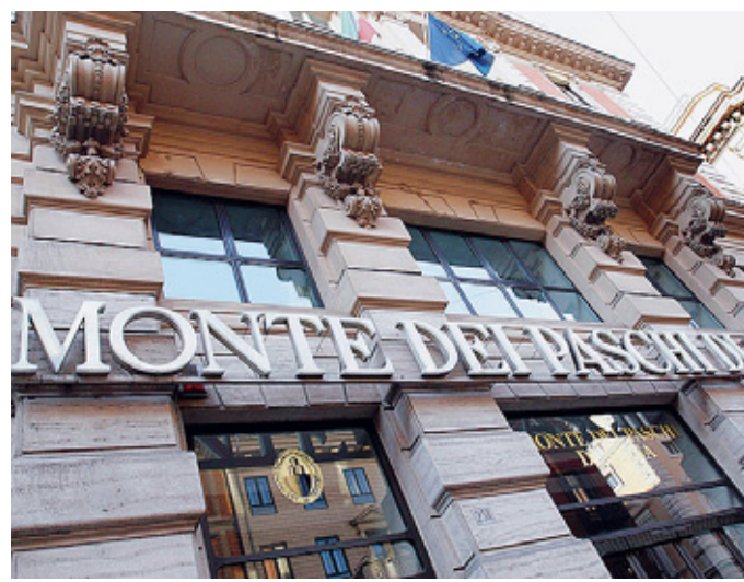
Monte dei Paschi Risultati più deboli delle attese nei primi 6 mesi.

La borsa non gradisce i conti di Mps. Il titolo, reduce dalla pulizia di bilancio che ha portato la banca a chiudere il semestre in rosso per 1,67 miliardi di euro, ha terminato la seduta in fondo al Ftse Mib, in calo del 7,97% a 0,22 euro. La maxi-perdita, frutto della svalutazione degli avviamenti, spalancò le porte all'ingresso del Tesoro, che si vedrà pagare le cedole sui Monti-Bond in azioni ritornando a essere socio di un istituto di credito