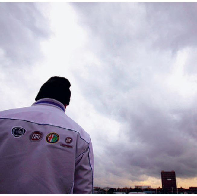
Pomigliano d'Arco Stop di due settimane dal 24 settembre.